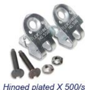
Hinged plated X 500/s